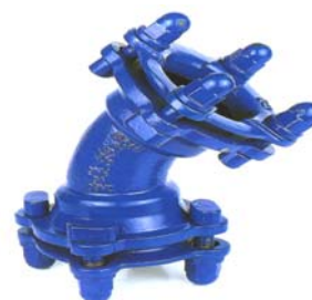
CODO 45° CON DOS ENCHUFES