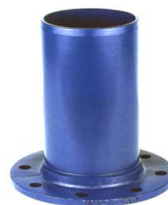
BRIDA- LISO PN 16