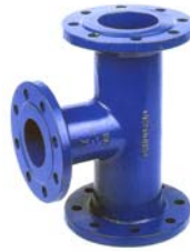
TE CON TRES BRIDAS PN-16