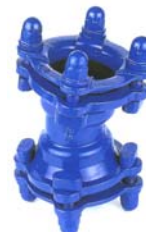
CODO 11° CON DOS ENCHUFES