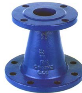
CONO DE REDUCCION CON DOS BRIDAS PN-16