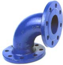
CODO 90° PN-16