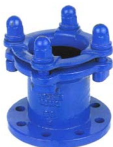
BRIDA -ENCHUFE PN 16