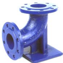
CODO 90° CON ZAPATA