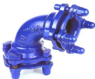
CODO 90° CON DOS ENCHUFES