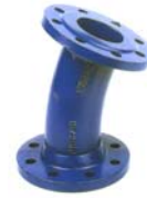
CODO 22° 30''