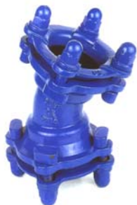
CODO 22° CON DOS ENCHUFES